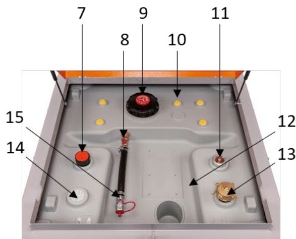
DT-Mobil PRO PE ADR 980 COMPACTE Nourrice